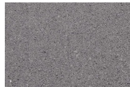
kvarc jednobojna - grafit siva