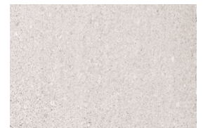
kvarc jednobojna - bela