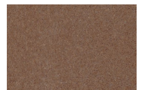
kvarc jednobojna - braon