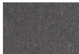
kvarc jednobojna - crna