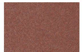
kvarc jednobojna - bordo