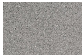
kvarc jednobojna - cement siva