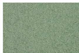
kvarc jednobojna - zelena