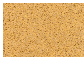
kvarc jednobojna - žuta