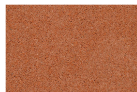
kvarc jednobojna - cigla