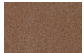
kvarc jednobojna - braon