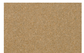
kvarc jednobojna - pesak žuta