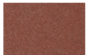
kvarc jednobojna - bordo