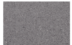
kvarc jednobojna - grafit siva