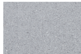
kvarc jednobojna - titan siva